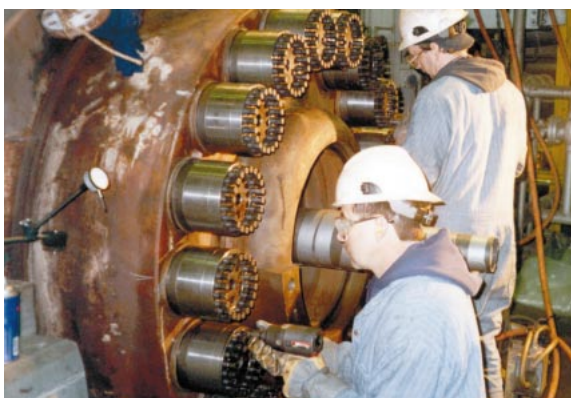
ボイラ給水ポンプのカバーの締結に。